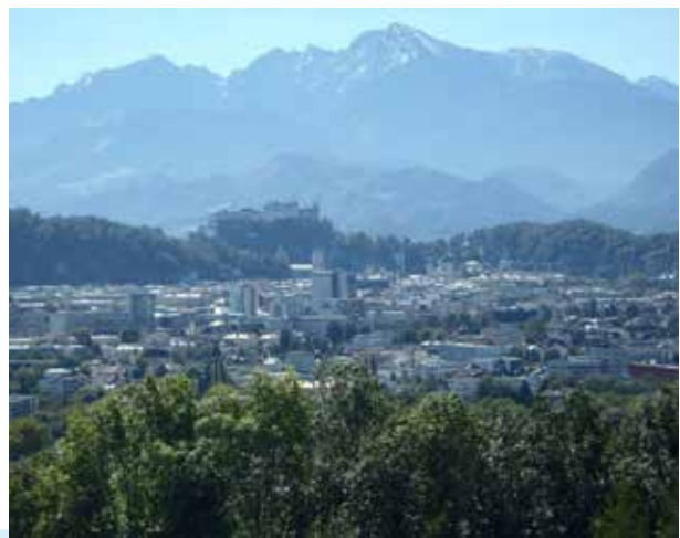
Sortie terrain dans une commune voisine de Salzbourg avec une superbe vue sur la ville.

"Mon entretien avec le directeur de l'association régionale de la ville de Salzbourg et des communes voisines m'a fourni des retours enrichissants sur la coopération entre la ville et les communes périphériques ainsi que sur la mise en place d'une ceinture verte intermunicipale".