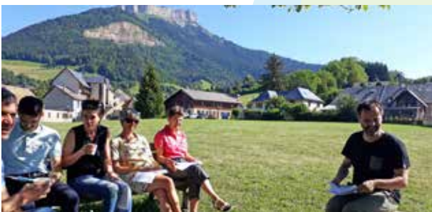
Atelier LOS_DAMA! organisé par GAM avec des acteurs locaux au Sappey-en-Chartreuse.