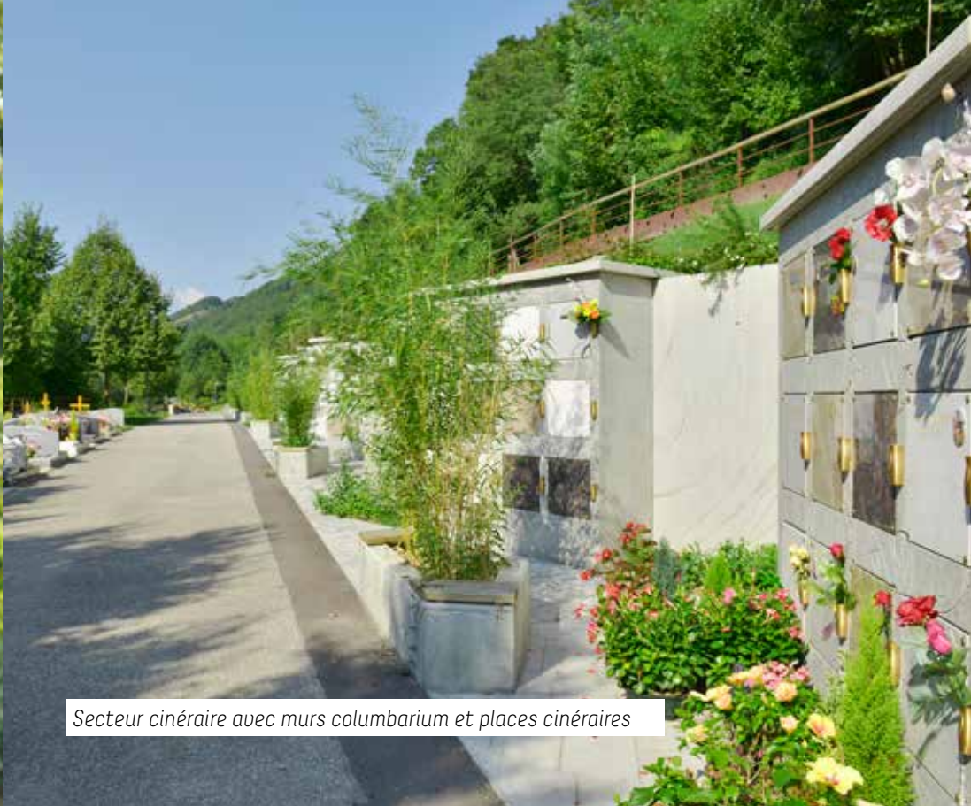
Secteur cinéraire avec murs columbarium et places cinéraires