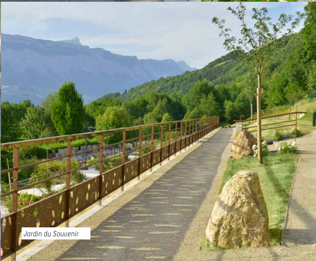
Jardin du Souvenir