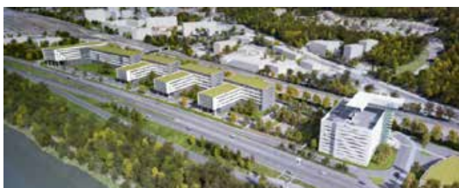
Aménagement du Parc d'Oxford