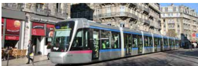
Contribution au SMTC