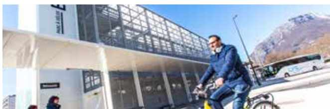
Parcs à vélo du Pôle d'échange multimodal