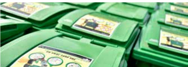
Déploiement de la gestion publique des bacs de collecte