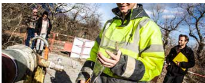
Chantier du raccordement de Vif / le Gua / Varcès