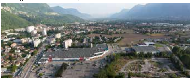
Aménagement des Portes du Vercors