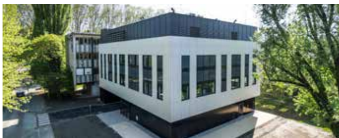
Le pôle BEEsy, "Biologie Environnementale et Systémique"