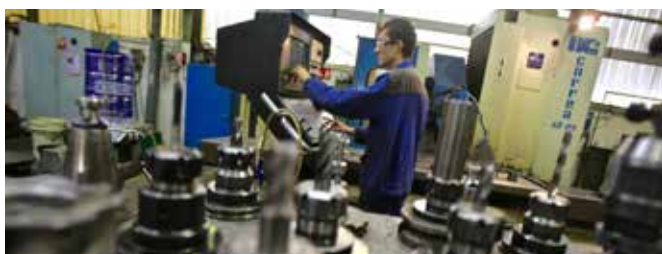
Soutien à la filière mécanique-métallurgie