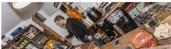
Soutien au commerce et à l'artisanat