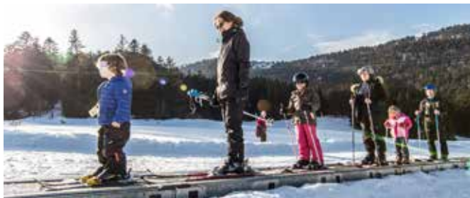
Développement du Col de Porte

Quelques exemples des principales actions qui seront menées par la Métropole sur son territoire en 2017