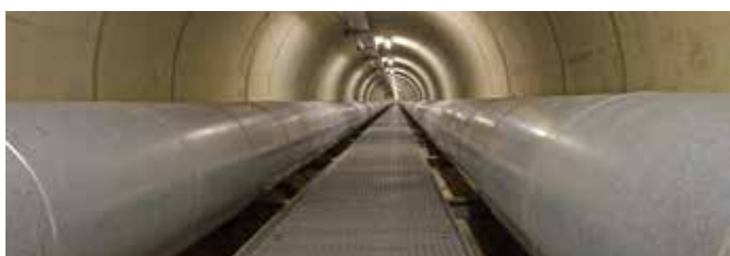
Développement des réseaux de chaleur