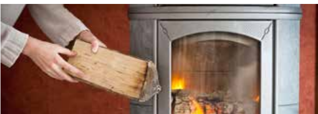
La Prime Air Bois pour la qualité de l'air