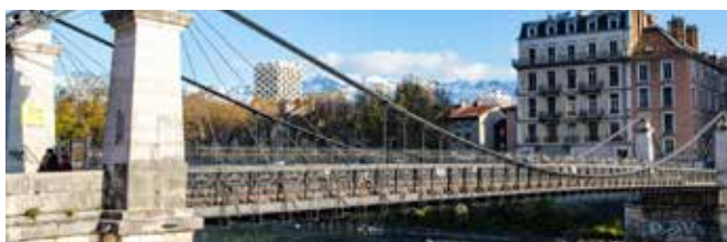
Travaux sur ouvrages d'art